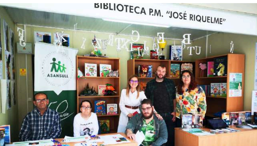
Imagen de la Unidad de Accesibilidad Cognitiva en la Feria del Libro de La Línea.