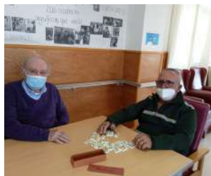
Taller de Juegos