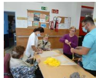
Taller de Punto, Crochet y Costura