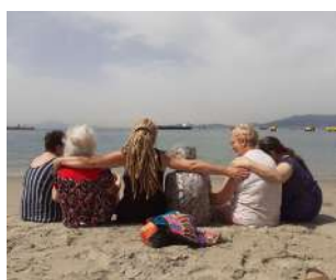
Ocio y Tiempo Libre