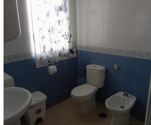
BAÑOS / ASEOS