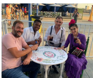
ACTIVIDADES DE OCIO