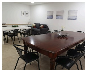
SALA / COMEDOR