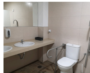
BAÑOS / ASEOS