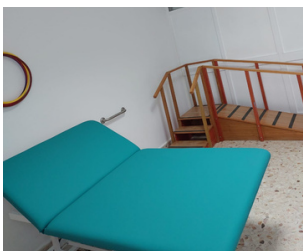
SALA DE REHABILITACIÓN