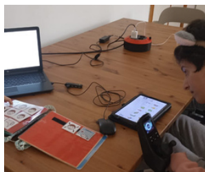
TALLER DE COMUNICACIÓN