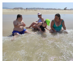
OCIO EN COMUNIDAD