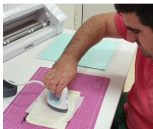
TALLER DE SERIGRAFÍA