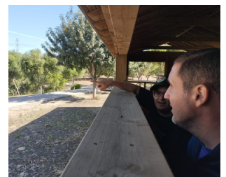
OCIO Y TIEMPO LIBRE

CENTRO de DÍA OCUPACIONAL para PERSONAS con disCAPACIDAD INTELECTUAL "VILLA CARMELA"